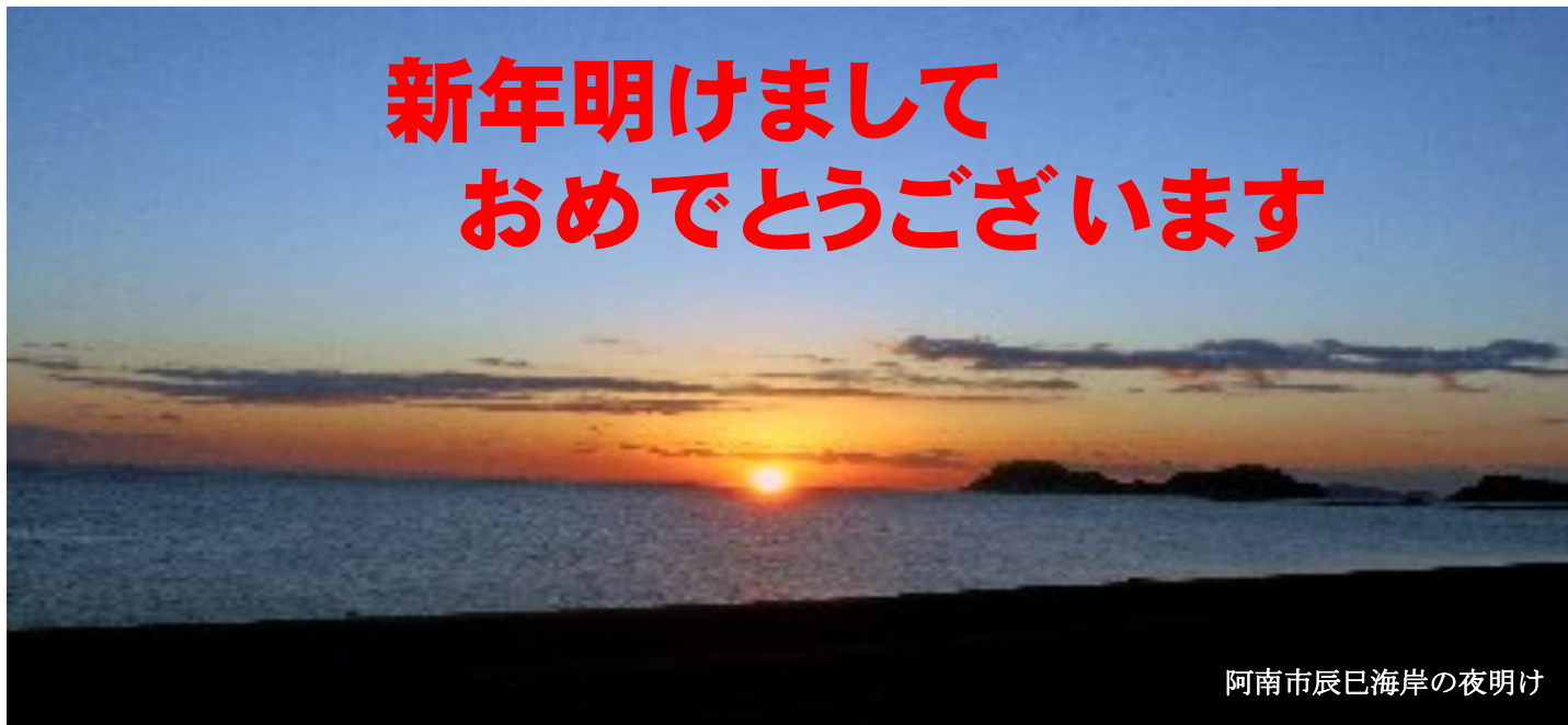
阿南市辰巳海岸の夜明け